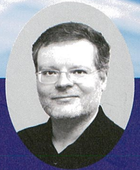
ピアノ ヴォルフラム・コロセウス マインツ音楽大学教授・元同大学学長

1955年生まれ。19歳で渡欧。ウィーンにて、W.バリリ、R.オドノボゾフ、ロンドンにてN.プライニン、N.ミルシュタインの各氏に師事。1980年から19年間にわたり、ドイツのマンハイム国立劇場管弦楽団コンサートマスター。 2015年より松江クラシックス音楽祭音楽監督。聖書と、アウグスティヌス及びキェルケゴールの著作を愛読。