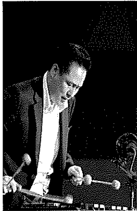
ヴィブラフォン奏者 Baek Jin Woo ペク・ジンウ

今年は石見銀山世界遺産登録 10 周年を祝い、 クリスマスコンサート初の外国からのゲストをお呼びいたします。 賛助出演は、2015 年、2016 年、2017 年大邱国際ジャズフェスティバルに 出演したメンバーです。