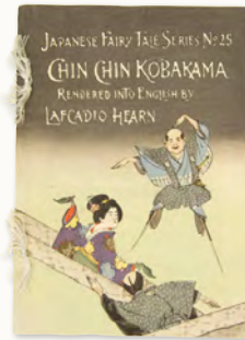
『ちんちん小袴』初版本 (小泉八雲記念館蔵)