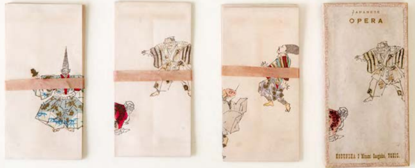
ハーンの家で愛用した小封筒には狂言の演目が描かれている 左から「三番三」「伯母ヶ酒(箱も)」「蚊相撲」(小泉八雲記念館蔵)